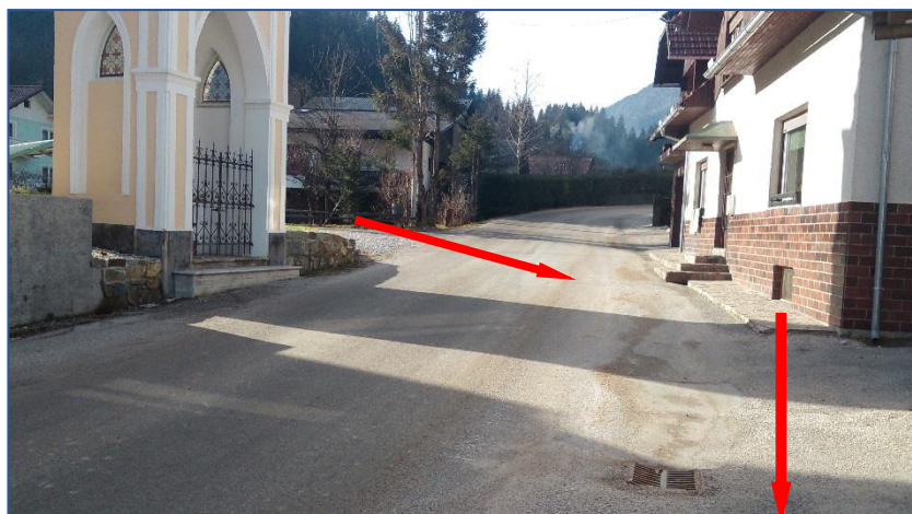
Križišče na Farovškem logu

Prečkanje ceste – učenci, ki pridejo iz Farovškega loga (prečkajo pri kapelici – ni prehoda, proti šoli gredo ob cesti, kjer ni pločnika).