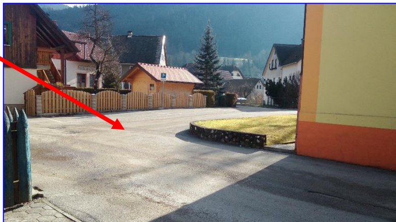
Pred šolskim vhodom

Odhod kombijev pred šolo; večina odpelje istočasno, učenci za Podvolovljek in Solčavo stojijo pred vhodom šole.