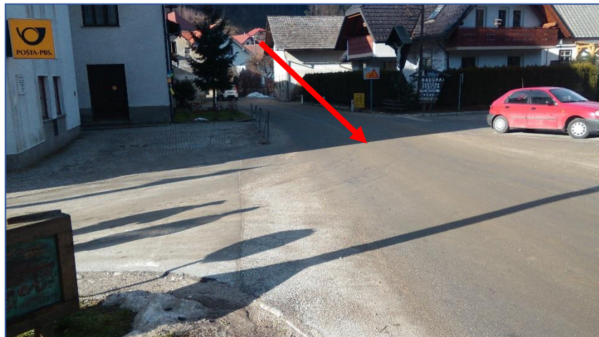
Križišče pri gasilskem domu

Odhod kombijev pred šolo; večina odpelje istočasno, učenci za Podvolovljek in Solčavo stojijo pred vhodom šole.