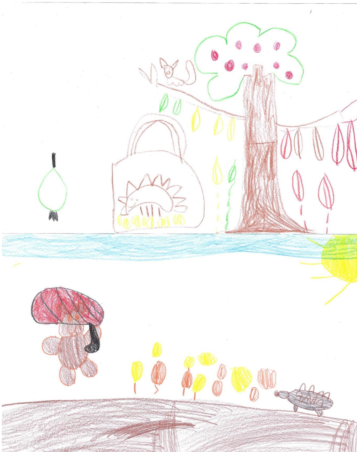
SINJA IN PIKA